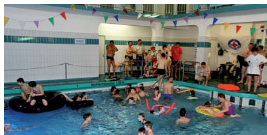
8. Januar 2017: 9. Silberstrom-Familien-Badetag ■ Seite 9