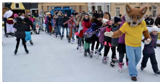
Silberstrom-Eisarena, 15.01. bis 26.02.2017 ■ Seite 10