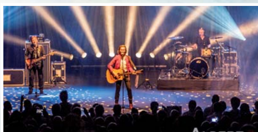
Vorschau auf Eventsaison 2018 ■ Seiten 12 – 13