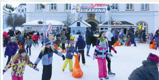
Vorschau: Auch 2018 Silberstrom-Eisarena ■ Seite 10