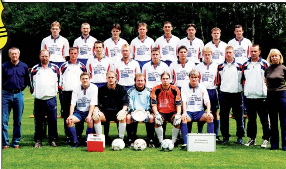
Aufstiegsmannschaft der Saison 2000 / 2001. Größter Erfolg des Vereins war der Aufstieg in die Landesliga im Jahre 2001