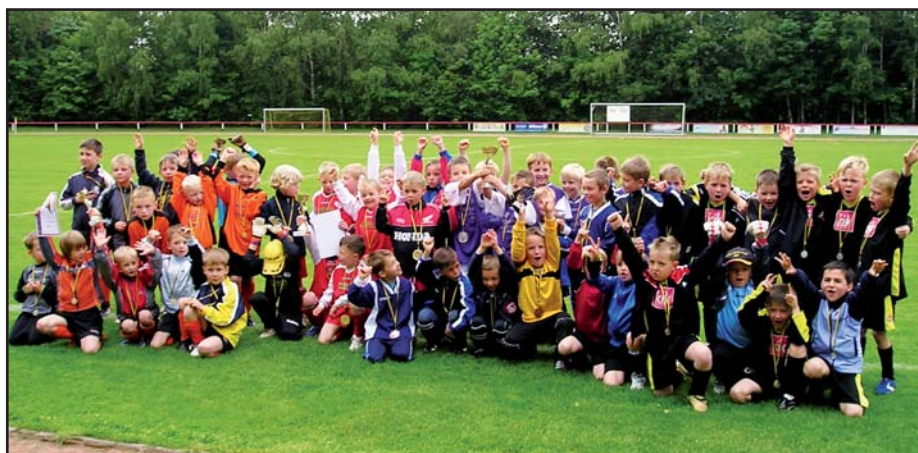
Bambiniturnier im Sommer 2009.

Die Stadtwerke Schneeberg unterstützen den Fußballclub sowohl finanziell als auch