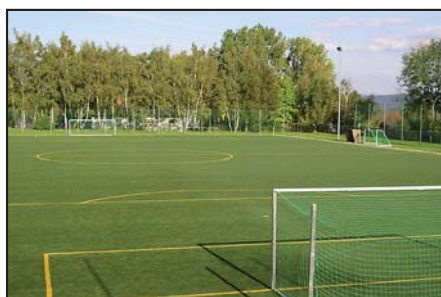
Der Nebenplatz mit Kunstrasen.

materiell, z.B. mit Spielkleidung. Haben Sie auch die Liebe zum Fußball entdeckt? Oder Sie wollen sich zum Schiedsrichter ausbilden lassen? Dann melden Sie sich doch einfach beim FC Concordia.