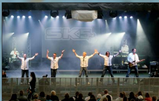
Was für eine Riesenparty... Rückblick auf die große Silberstrom-Party Filzteichfest