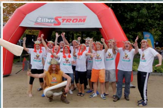
Die Herausforderer: „Vikie und die Silberstromer“.