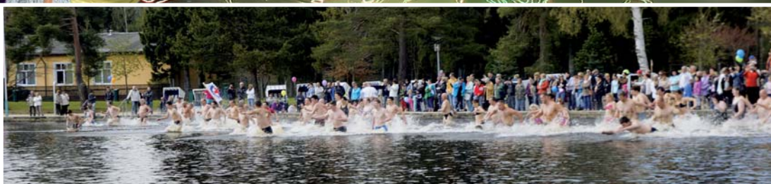
Anbaden am Filzteich 2015: Und die Wanne war voll...