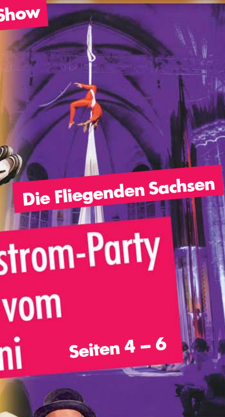
Die Fliegenden Sachsen

Große Silberstrom-Party Filzteichfest vom 14. - 16. Juni