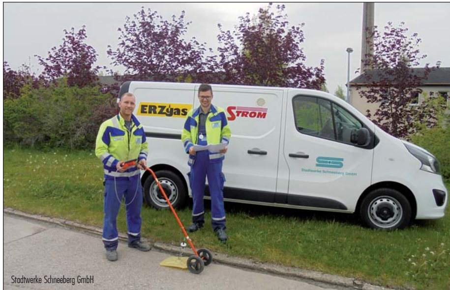
Stadtwerke Schneeberg GmbH