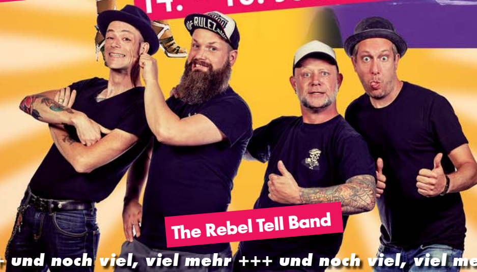
The Rebel Tell Band

+++ und noch viel, viel mehr +++ und noch viel, viel mehr +++