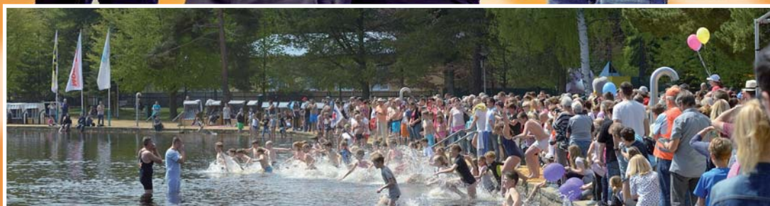
Rückblick: 4.000 Besucher eröffneten die Bade- und Eventsaison am Filzteich - Rekord!

+++ und noch viel, viel mehr +++ und noch viel, viel mehr +++